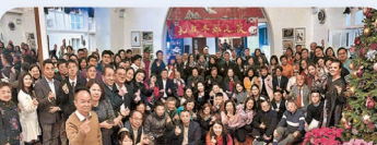
▲孔教學院癸卯冬至節前夕聯歡晚會合照。

2023年12月21日(星期四)，孔教學院假「石澳鄉村俱樂部」舉辦「孔教學院癸卯冬至之夜聯歡晚會」。活動旨在推廣華夏傳統節日。當晚現場熱鬧溫馨，氣氛歡欣。孔院上下與一眾嘉賓，一同享用豐富美味的自助晚宴，一起渡過了一個愉快的冬至節前夕。