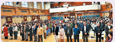
▲孔教學院同仁暨屬校教師員出席，孔教學院九十三周年院慶暨大成小學、大成何郭佩珍中學校慶典禮。

孔曆二五七四年(癸卯)十一月六日(西元2023年12月18日)，為孔教學院九十三周年院慶暨大成小學、大成何郭佩珍中學校慶何郭佩珍中學校教師員生，舉首一堂，假座孔教學院大成何郭佩珍中學湯湯學堂，隆重舉行慶祝典禮。